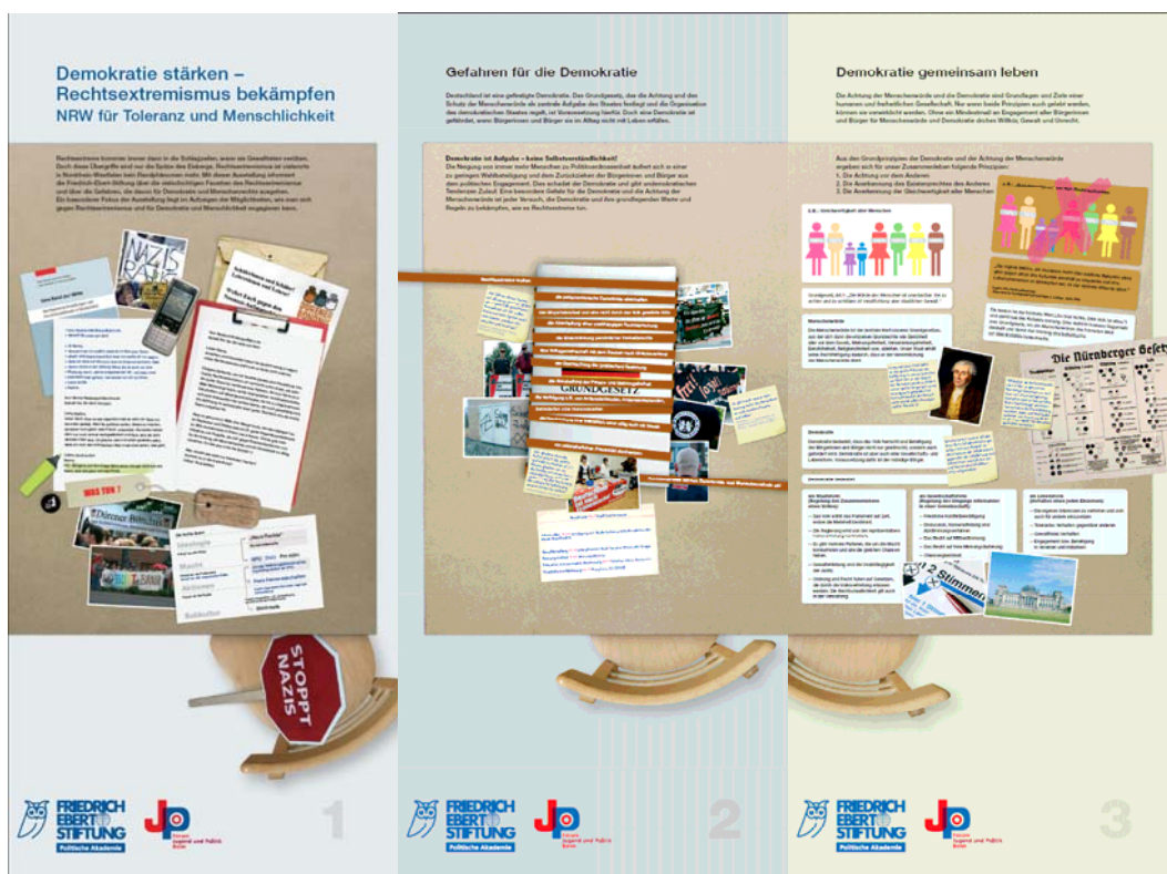
Tafel 1 „Demokratie stärken – Rechtsextremismus bekämpfen“, Tafel 2 „Gefahren für die Demokratie“ und Tafel 3 „Demokratie gemeinsam leben“