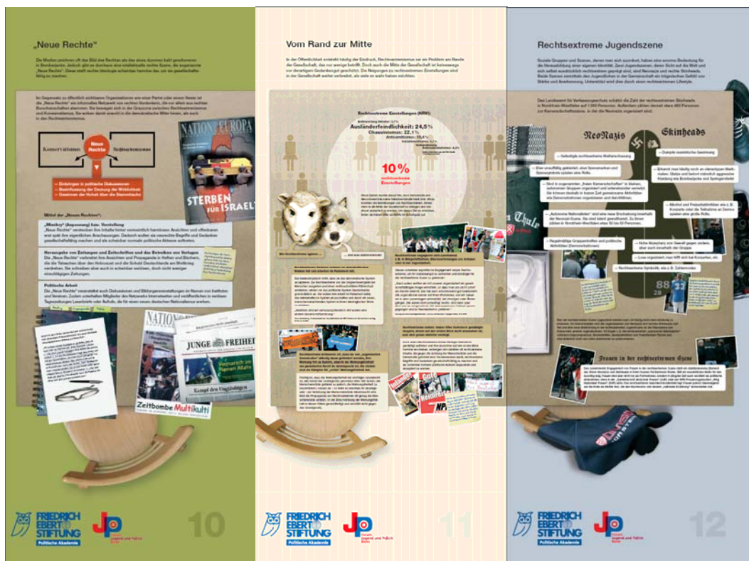
Tafel 10 „Neue Rechte“, Tafel 11 „Vom Rand zur Mitte“ und Tafel 12 „Rechtsextreme Jugendszene“