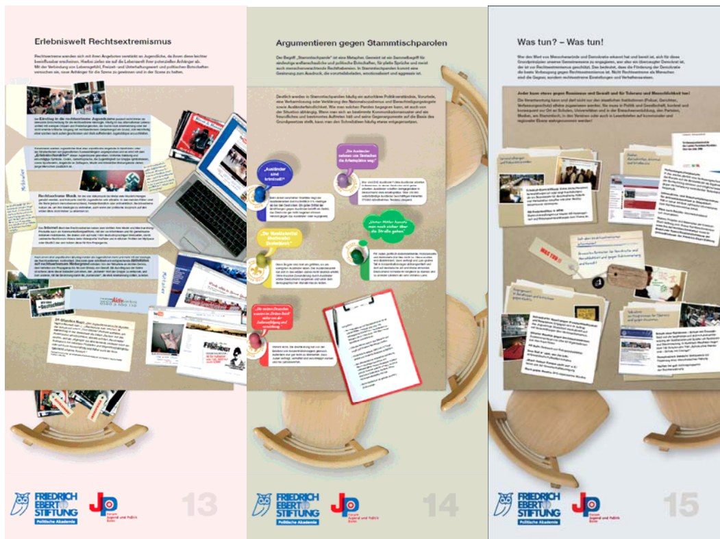
Tafel 13 „Erlebniswelt Rechtsextremismus“, Tafel 14 „Argumentieren gegen Stammtischparolen“ und Tafel 15 „Was tun? – Was tun!“