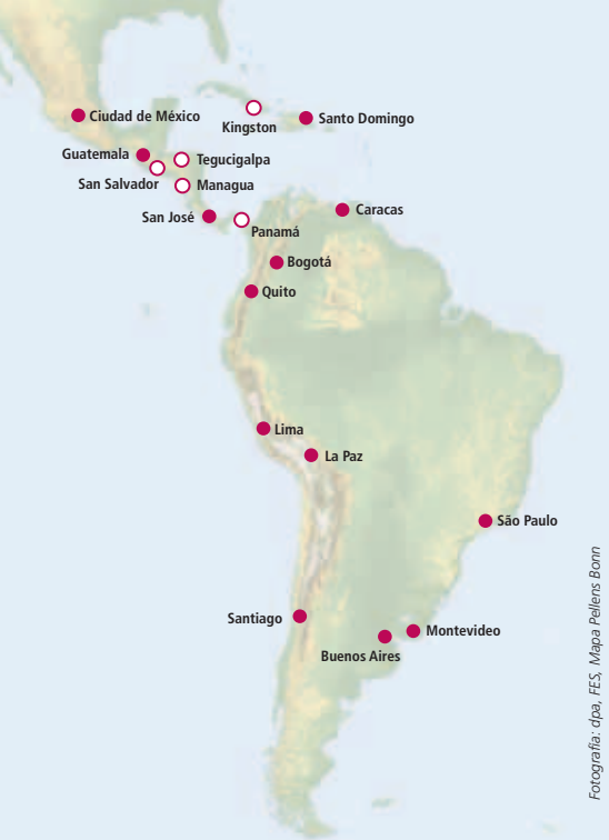
Fotografía: dpa, FES, Mapa Pellens Bonn