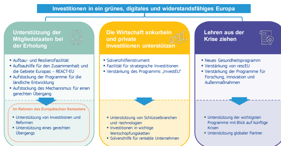
Abbildung 2: „Next Generation EU“ – Vorschlag der EU-Kommission vom 27.05.2020

Quelle: https://ec.europa.eu/info/sites/info/files/factsheet_1_de_v2.pdf