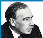
Keynes Gesellschaft Regionalgruppe Nord

Anmeldung: niedersachsen@fes.de (Rückfragen: 0511 357708-30)