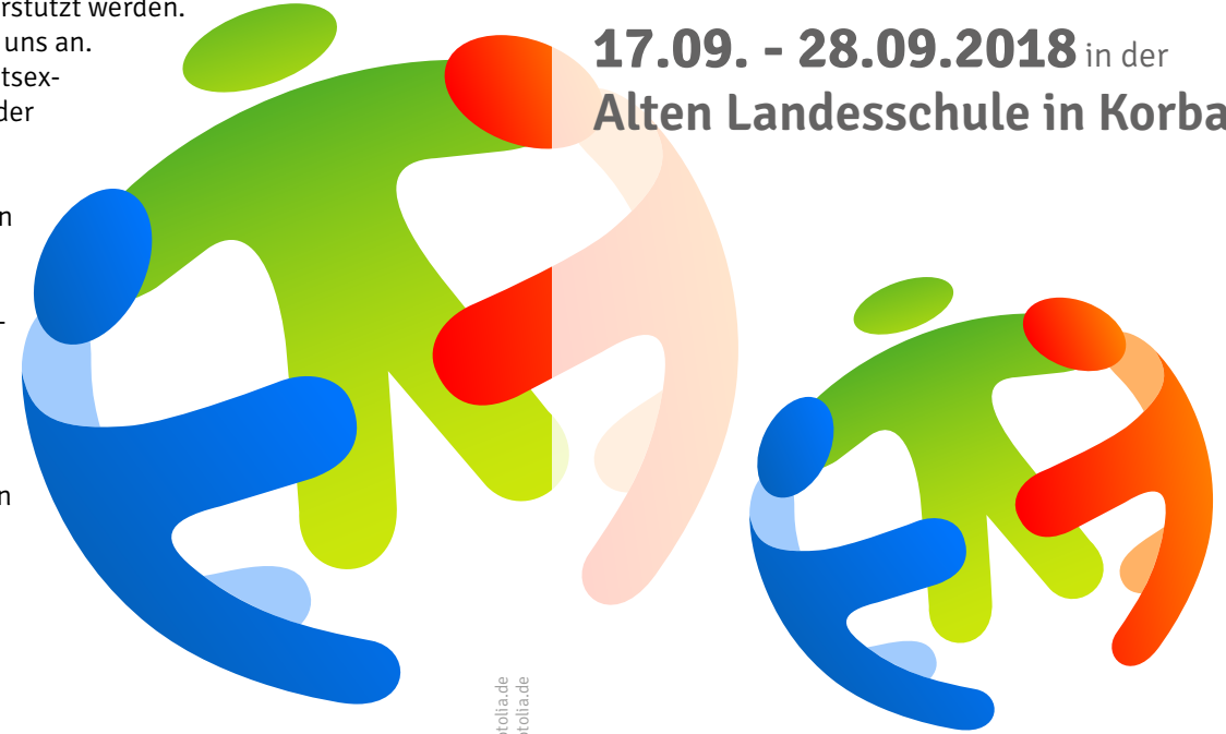
Zeichnung: (c) Schwarwel / Fotolia.de Symbol Gemeinschaft: (c) settingpix / Fotolia.de

17.09. - 28.09.2018 in der Alten Landesschule in Korbach