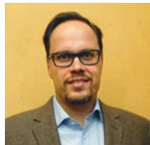
Dirk Panter Mitglied des Sächsischen Landtages, sächsischer SPD-Generalsekretär