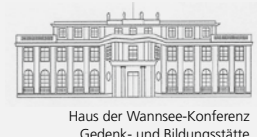
Haus der Wannsee-Konferenz Gedenk- und Bildungsstätte