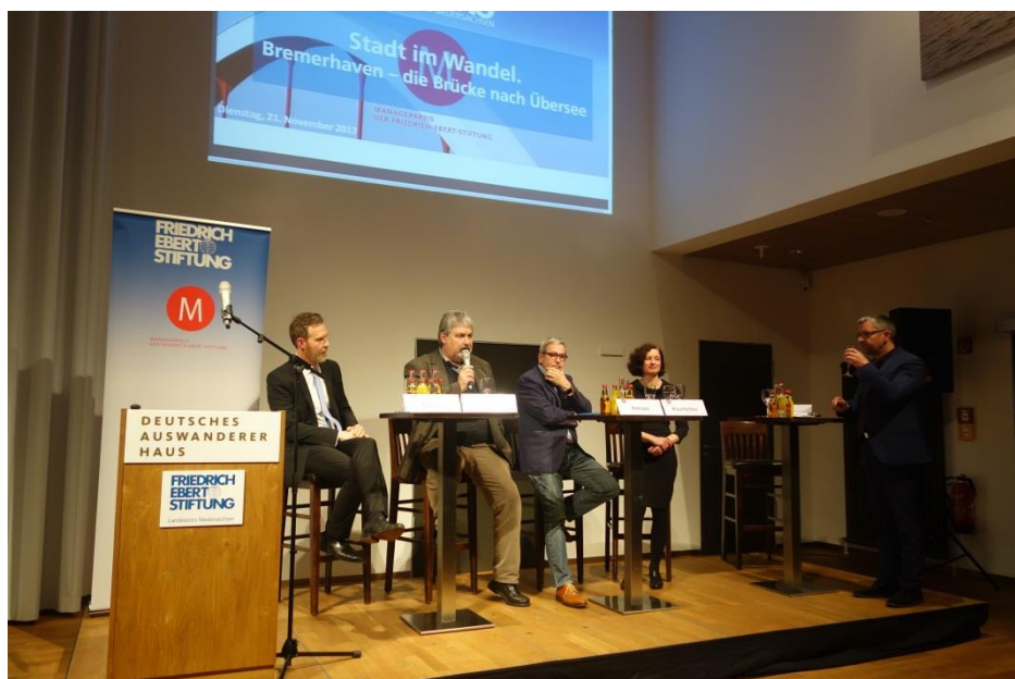
Podium der Veranstaltung am 21. November