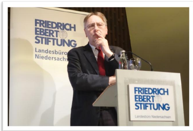
Bernd Lange, MdEP

dass der „Nationalstaat ökonomisch oder politisch noch existieren könne.“ Dabei sprach er insbesondere drei Themenblöcke an. Die noch stark bestehende Kluft zwischen Arbeit und Bezahlung, die hohe Jugendarbeitslosigkeit und die fehlende Steuergerechtigkeit. Als größtes Problem jedoch sah Lange die nationalistischen Bewegungen in den einzelnen Staaten.