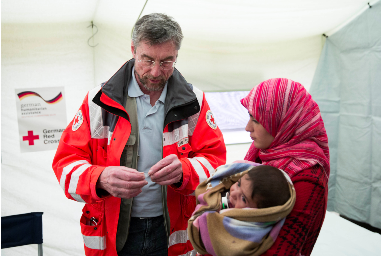
Abb.DRK/2/© Gero Breloer/DRK.