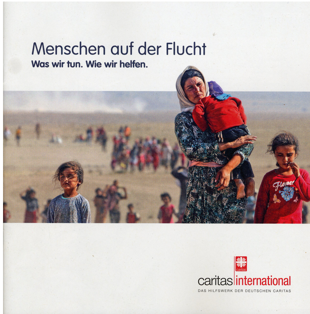
Abb.Ci/1/© Rodi Said.