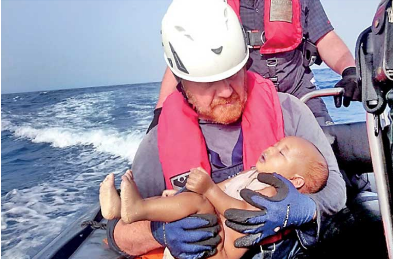
Abb.SW/1/© Christian Buettner/reuters.