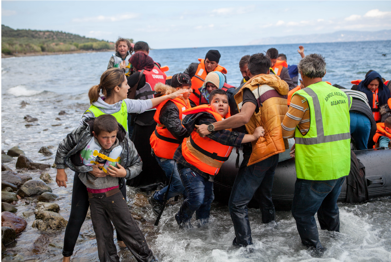
Abb.Ci/2/© Ben White/CAFOD.