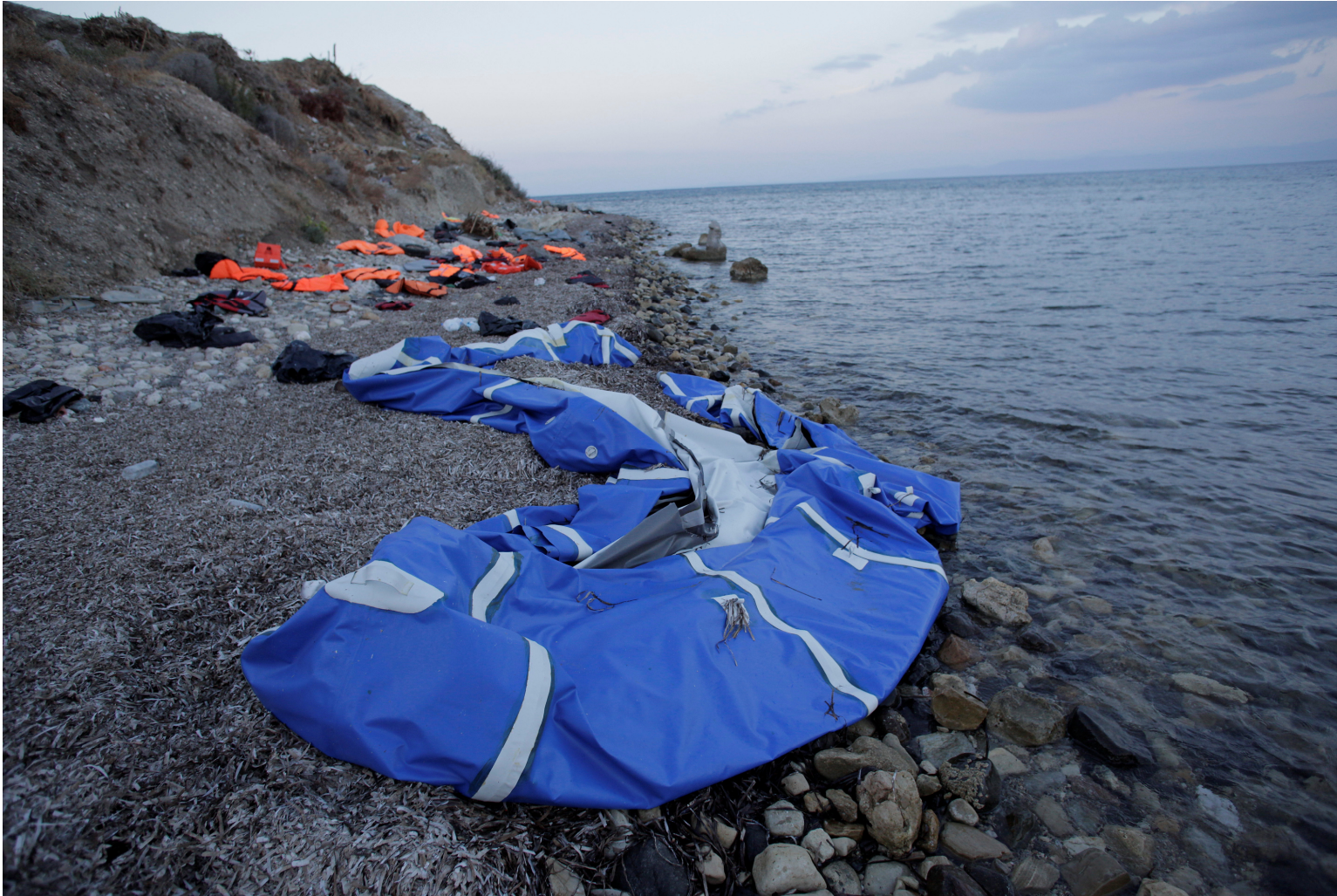
Abb.Ci/6/© Arie Kievit.