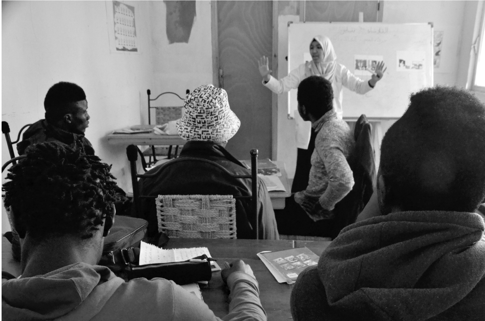
Abb.Ci/8/© Hermann Kenfack/Caritas international.