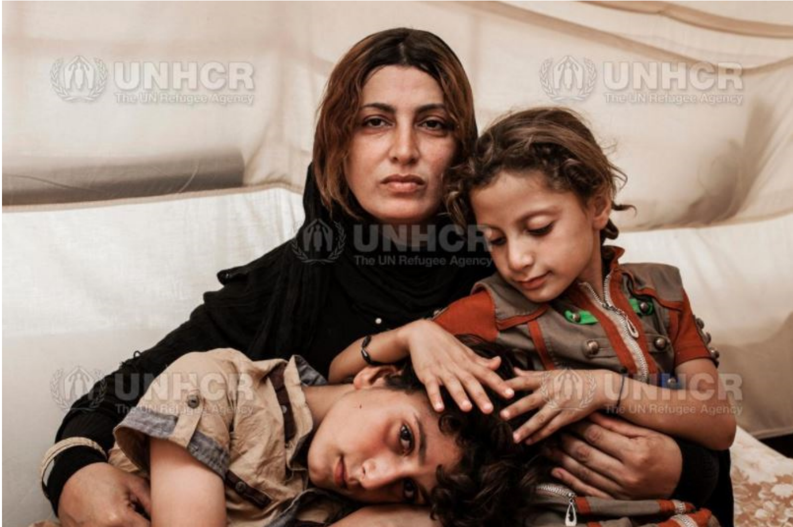
Abb.UNHCR/3/© UNHCR/Ivor Prickett.