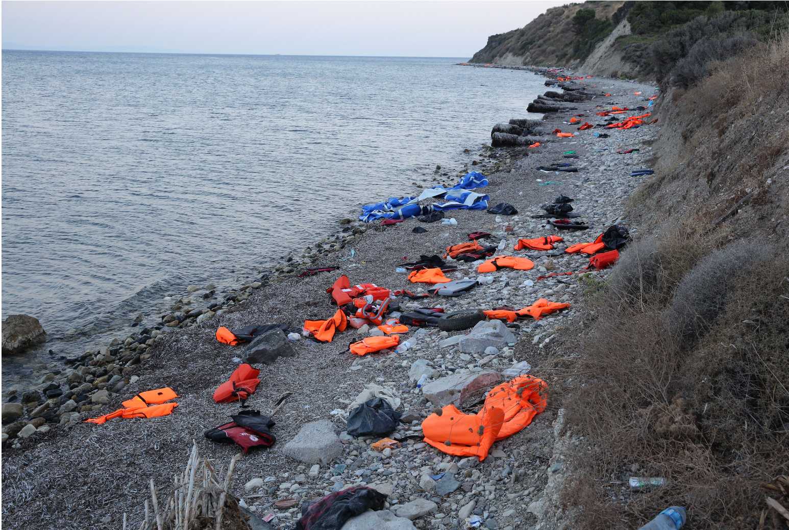
Abb.Ci/4/© Arie Kievit.