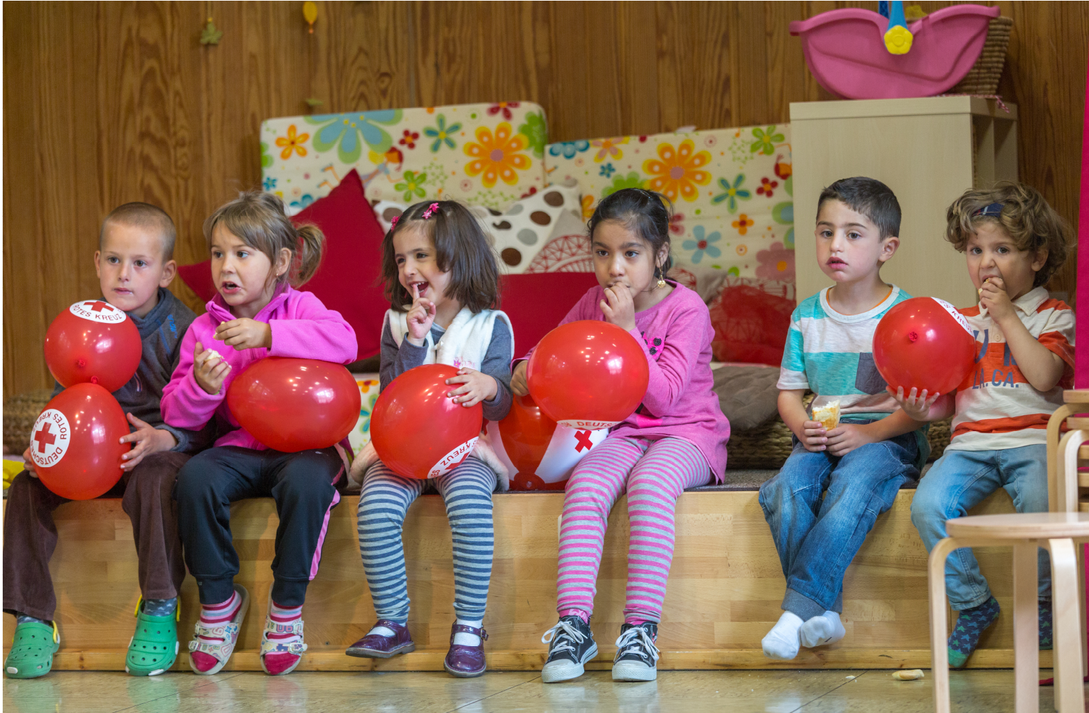
Abb. DRK/1/© Jörg F. Müller/DRK.