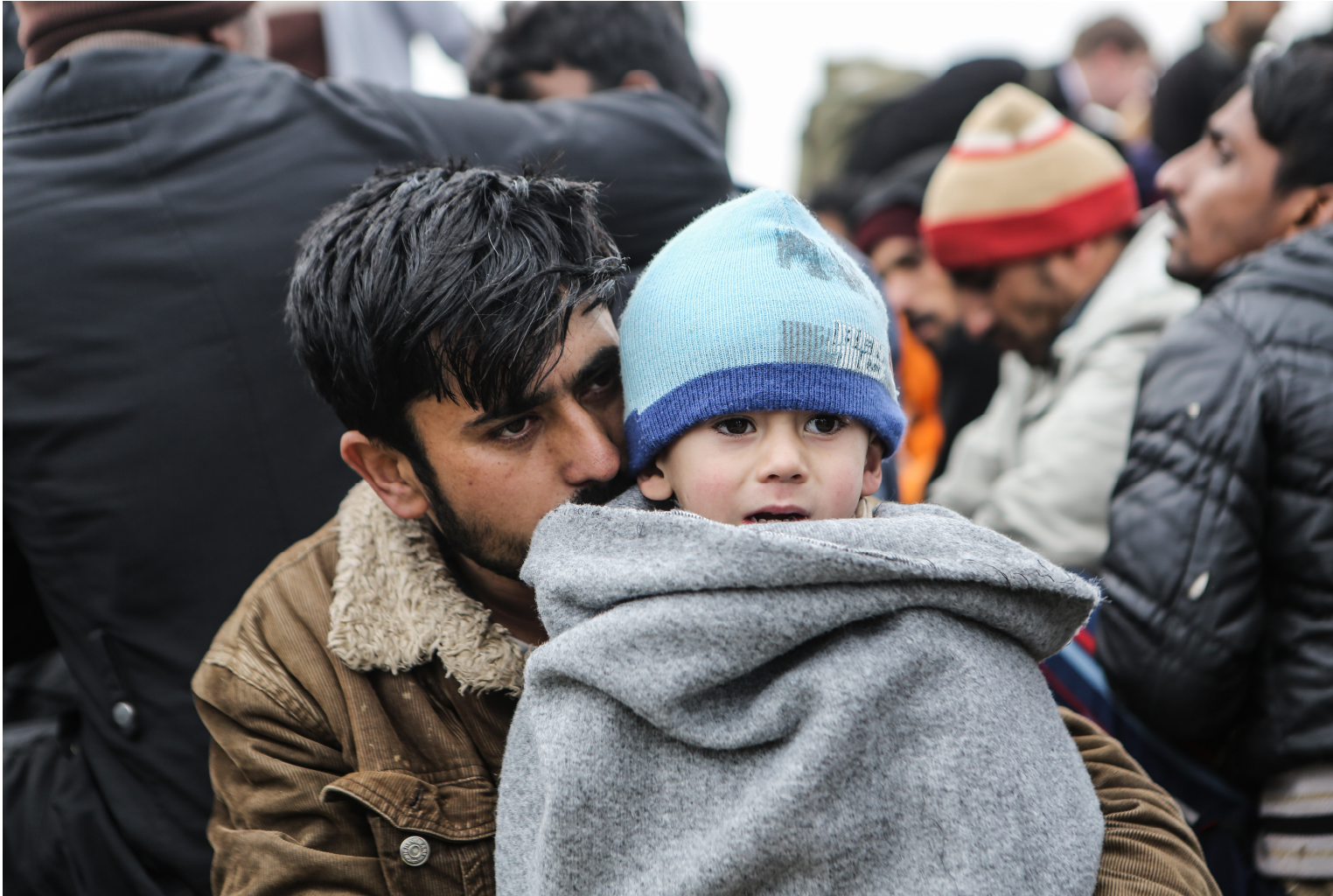
Abb.Ci/3/© Lefteris Partsalis/Caritas Schweiz.