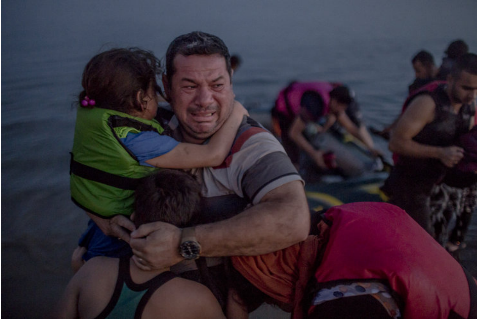
Abb. UNHCR/1/© UNHCR/Daniel Etter.