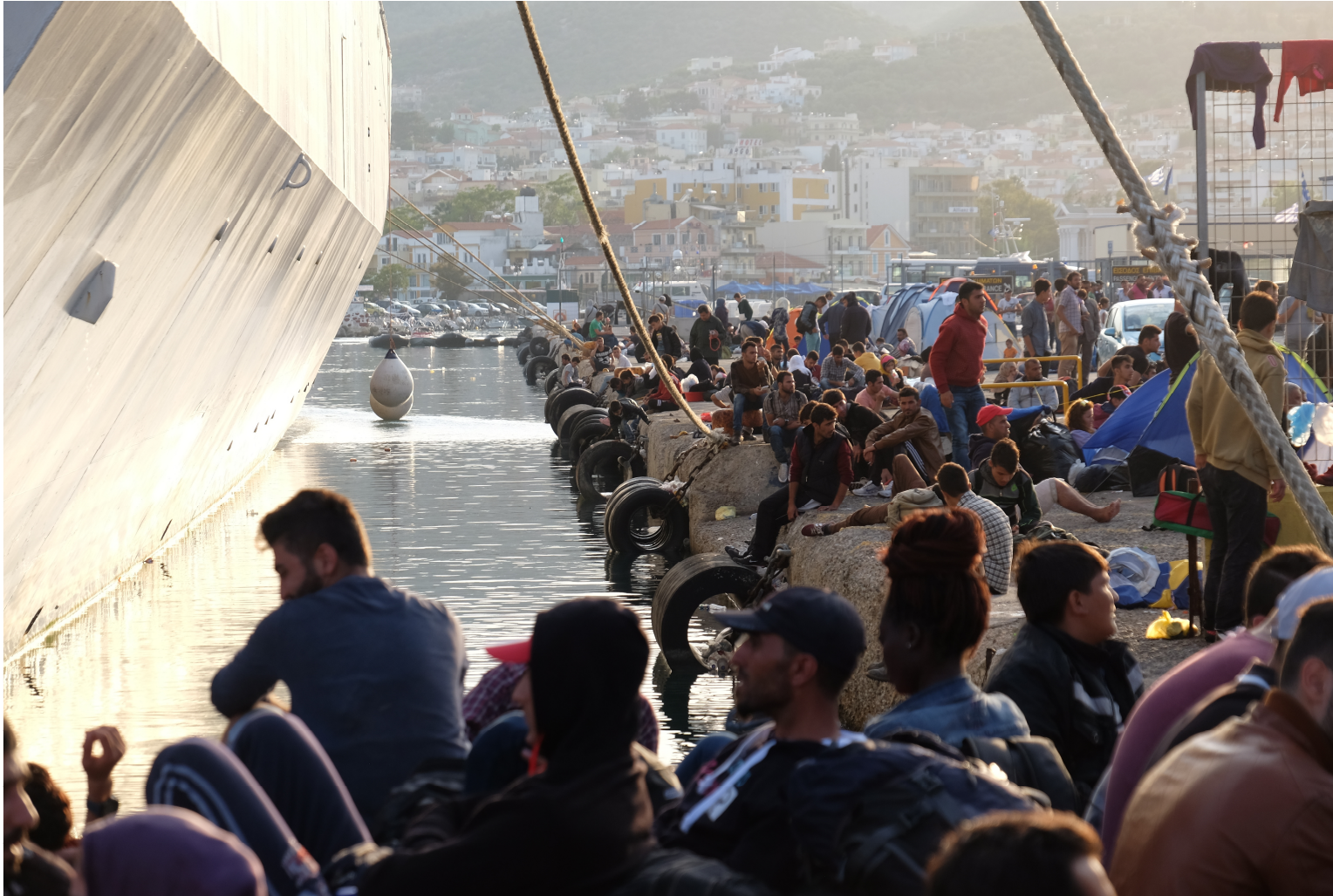
Abb.Ci/5/© Patrick Nicholson/Caritas international.