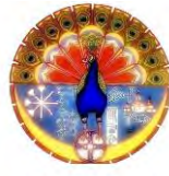
Yezidisches Forum e.V. in Oldenburg

Zentralrat der afrikanischen Gemeinde in Deutschland e.V.