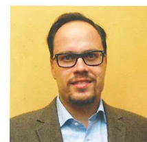
Dirk Panter Vorsitzender der SPD-Fraktion im Sächsischen Landtag

Diese Maßnahme wird mitfinanziert durch Steuermittel auf der Grundlage des von den Abgeordneten des Sächsischen Landtages beschlossenen Haushaltes.