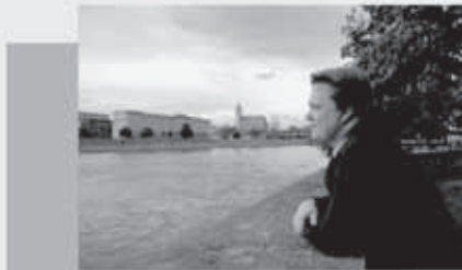
Lieblingsort in Magdeburg

Wenn ich den Unternehmen und den potenziellen Arbeitnehmern ein Umfeld schaffe, das es arbeits- und lebenswert macht, hier zu sein, dann habe ich als Stadt alles richtig gemacht. Dazu gehört einfach, abgesehen vom Kultur- und Freizeitangebot, wenn ich junge Leute hier halten will, muss ich auch kinderfreundlich sein. Ich denke, das ist hier durchaus gegeben. Und natürlich ist auch die Schaffung qualifizierter Stellen wichtig, denn es sind doch die Akademiker, die höher Qualifizierten, die dann auch mobiler rumreisen und schneller weg sind. Und um die geht es ja auch, dass man die wieder herholt.