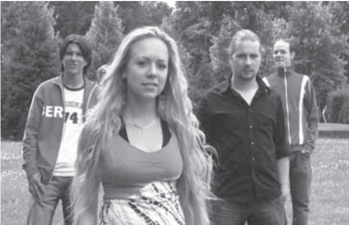
Namen der Bands: „Heart'n'soul“, „Drolfen Brichten“ und die „Katzenomas“, Denn