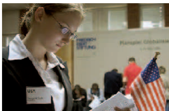
Alle Rollen besetzt: Eine Planspielteilnehmerin vertrat die Positionen des amerikanischen Präsidenten.

Oberstufenschüler/innen an. Am ersten Tag standen Informationen im Vordergrund. Was versteht man eigentlich unter Globalisierung und was sind die dringlichsten globalen Probleme? In die Rollen der Akteure schlüpfen die Teilneh-