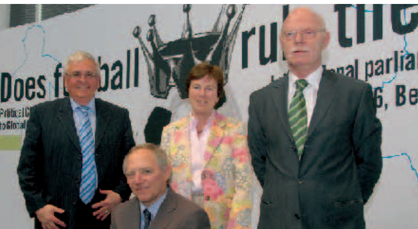
Einig über die integrative Kraft des Fußballs: Theo Zwanziger, Wolfgang Schäuble, Anke Fuchs und Peter Struck

Internationale Medienvertreter diskutierten die Außenwahrnehmung des Gastgebers Deutschland. In einem anderen Panel widmeten sich Experten aus Südkorea, Portugal, Frankreich und Deutschland der Analyse ökonomischer Effekte großer Fußballturniere. Dabei wurde davor gewarnt, deren Auswirkungen für eine Volkswirtschaft zu überschätzen.