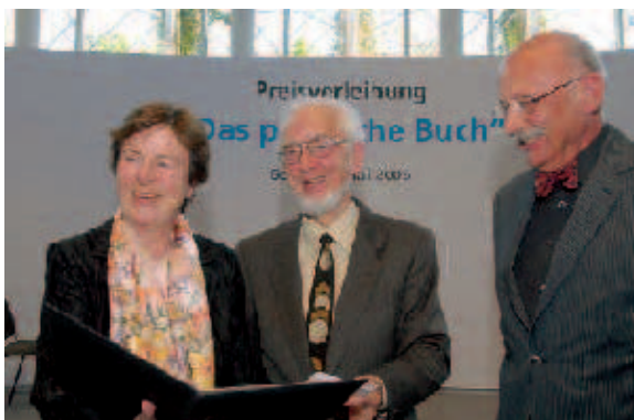
Preisträger Erhard Eppler nahm von Anke Fuchs die Urkunde entgegen.

Am 9. Mai übergab die Vorsitzende der FES, Anke Fuchs, den diesjährigen Preis „Das politische Buch“ an einen Nestor der deutschen Sozialdemokratie. Erhard Eppler wurde für sein bei Suhrkamp erscheinendes Buch „Auslaufmodell Staat?“ geehrt. Die aus Bibliothekarinnen, Bibliothekaren und einem Buchhändler bestehende Jury prämierte Erhard Epplers Appell „gegen leichtfertigen Staatsabbau und für ein Miteinander von Staat, Markt und Zivilgesellschaft im Rahmen eines reformierten demokratischen Rechts- und Sozialstaats“. In seiner Festrede würdigte der Generalsekretär der SPD, Hubertus Heil, Epplers Lebenswerk und hob