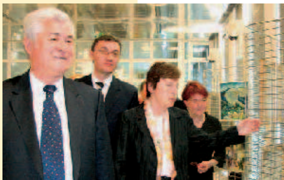
Die Vorsitzende der Friedrich-Ebert-Stiftung eröffnete zusammen mit dem Staatspräsidenten eine Gemäldeausstellung mit Werken zeitgenössischer Künstler aus Moldau (von links Vladimir Voronin, Staatspräsident der Republik Moldau; Igor Corman, Botschafter in Deutschland; Anke Fuchs).

Vor 470 Zuhörern, zu denen auch der Staatsminister im Auswärtigen Amt Gernot Erler zählte, betonte der Präsident: „Wir haben verstanden, dass die europäische Integration keine außenpolitische Option ist, sondern in erster Linie eine Option für einen bestimmten Weg der Modernisierung innerhalb unseres Landes.“ Bezüglich des Transnistrien-Konflikts wies er darauf hin, dass es sich dabei nicht um einen interethnischen Kon-