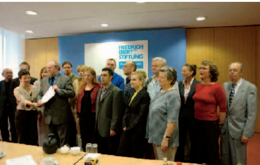
Bundestagsvizepräsident Wolfgang Thierse nahm das Bürgervotum von dessen versammelten Autor/innen entgegen.

— DEN URSACHEN VON RECHTSEXTREMISMUS und möglichen Gegenstrategien der Politik widmete sich eine Bürgerkonferenz im Rahmen des FES-Projekts „Auseinandersetzung mit dem Rechtsextremismus“.