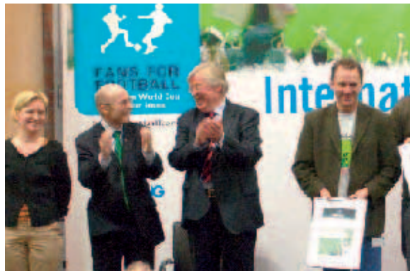
Schirmherr Willy Lemke (2.v.l.) überreichte die Preise für die besten Fan-Ideen.

Beim internationalen Fankongress der Initiative „Fans for Football“ im Bonner Haus der FES stand der Dialog von Fans und Fanexperten aus WM-Teilnehmerländern im Mittelpunkt. Über 150 Teilnehmer/innen aus 15 Ländern diskutierten am 6. und 7. April u.a. über die Kommerzialisierung des Sports, das Verhältnis von Fans und Sicherheitskräften oder das Thema Rassismus im Sport.