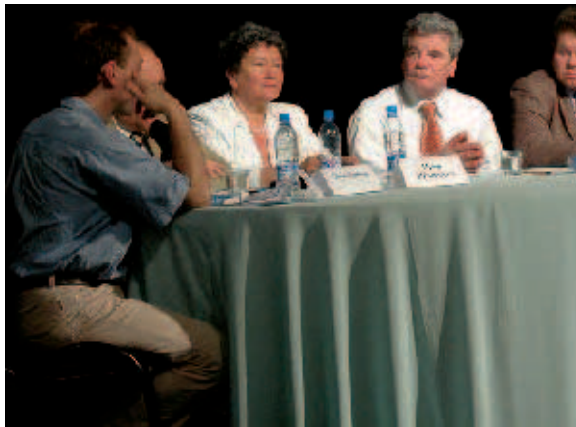
Gesprächspartner mit deutscher Perspektive: Dagmar Schipanski und Joachim Gauck auf dem usbekischen Podium zu Fragen der Zeitgeschichte.

sich heraus, wie schwierig sich die Aufarbeitung der Geschichte in einem Land gestaltet, das multi-ethnisch und multi-religiös ist. Jedes Volk innerhalb Usbekistans habe eine ganz unterschiedliche Sicht auf die Vergangenheit gab ein junger Teilnehmer zu bedenken. Doch, so Dagmar Schipanski, „ohne Herkunft keine Zukunft“ und Joachim Gauck fügte hinzu, dass es einem Volk besser gehe, wenn es Scham und Trauer zulassen könne: „Ich misstraue allen Völkern, die nur über Helden und Großtaten sprechen.“