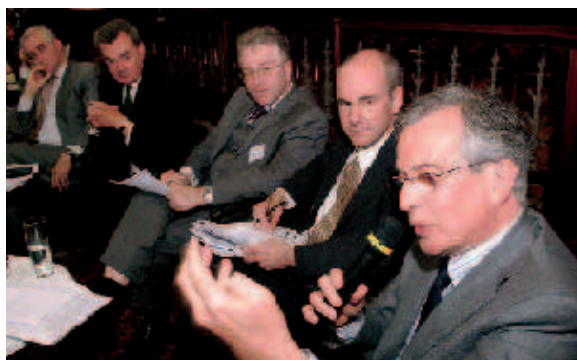
Als naiv bezeichnete Eneko Landaburu (im Bild vorn), Generaldirektor für Außenbeziehungen der Europäischen Kommission, die Erwartung, die EU könne nur durch ihre „soft power“-Politik globaler außenpolitischer Akteur werden.

dem Balkan, im Kaukasus, in Afghanistan und auch im Irak. Dieses Engagement wurde von allen Teilnehmern als wichtiger Kontrast zur „hard power“ der USA gesehen. Es sei wichtig, so die einhellige Meinung, dass die EU ihre Werte mit mehr Selbstbewusstsein ausdrückt. Angesichts des Ausgangs der Referenden in Frankreich und in den Niederlanden ist aber der im Verfassungsvertrag vorgesehene „europäische Außenminister“ vorerst in weite Ferne gerückt. Nur ein in den Verträgen verankerter Außenminister kann Europas Politik mit dem notwendigen Durchsetzungsvermögen vertreten.