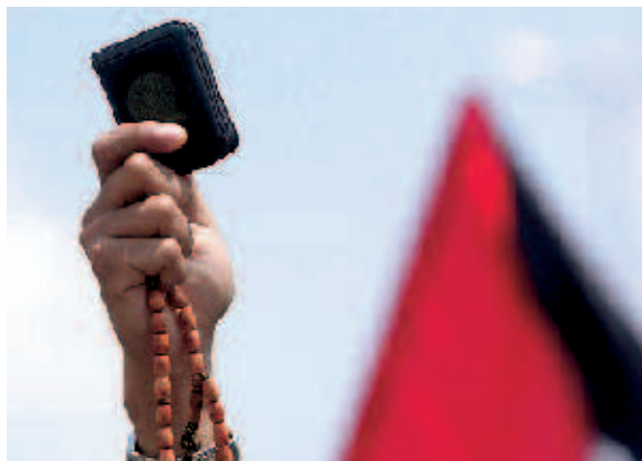
Woher stammen die politischen Erfolge islamistischer Bewegungen im Nahen Osten und in Nordafrika? Eine Fachtagung der FES suchte nach Antworten.

ten zu klären, welche politische Strategie zwischen Repression, Isolierung, Marginalisierung und Einbindung gegenüber islamistischen Bewegungen