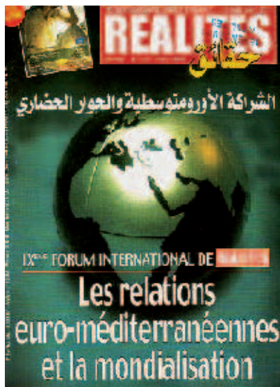
Partner des FES in Tunesien: Die Wochenzeitschrift „Realités“

Aus Sicht der südlichen Mittelmeerländer ist die Globalisierung eine Bedrohung, die