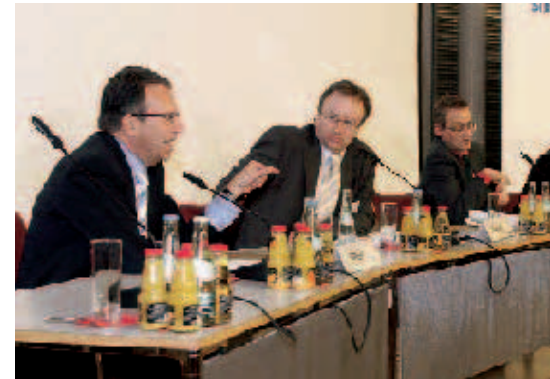
Angesichts der Situation auf dem Arbeitsmarkt kann aus Sicht von Frank-Jürgen Weise (links) derzeit auf einen öffentlich finanzierten „zweiten“ Arbeitsmarkt nicht verzichtet werden.

Frank-Jürgen Weise, Vorstandsvorsitzender