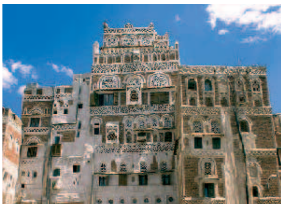
Adresse mit Charme: In diesem Haus hat das FES-Büro im Jemen seinen Sitz.

Der Jemen befindet sich in vielerlei Hinsicht in einer Randlage und ist entsprechend isoliert. Er ist anders als seine Nachbarstaaten keine reiche Ölmonarchie, sondern eines der ärmsten Länder der Welt, dabei jedoch