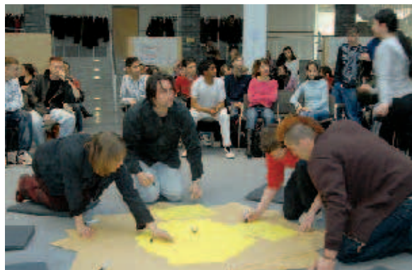
Konzentriert und zielgerichtet: Die Teilnehmer/innen des Open Space bestimmen ihre Themen selbst.

gang mit rechtsgerichteten Jugendlichen. Nicht mehr alle