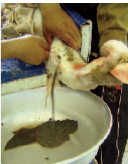
Kleine Menge, hoher Preis: Kaviar als wichtiger Wirtschaftsfaktor in Kasachstan

wusst, nur zum geringeren Teil jedoch unzufrieden mit der eingeschränkten Pressefreiheit. Es überwiegt Pragmatismus. Man konnte sich nicht einigen, ob Kaviar oder Öl die wertvollere Ressource sei. Die These, Kaviar sei die bessere, weil, bei ausreichendem Schutz der Störe, theoretisch unendlich zur Verfügung stehend, stieß eher auf Skepsis. „Dazu muss man sehr langfristig denken, und das tut hier keiner“, so das Fazit eines Journalisten.