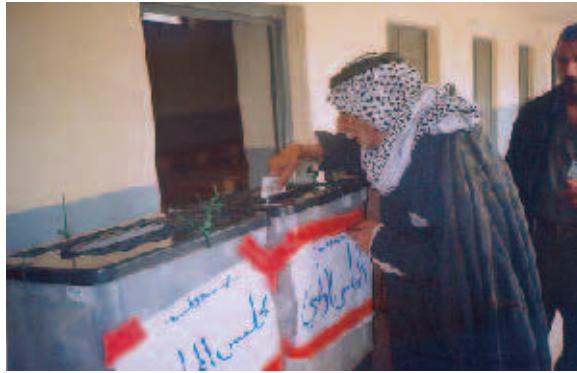
Wahlen unter besonderem Interesse: Die FES unterstützte unter anderem die Ausbildung von Wahlbeobachtern.

wurde Niqash, ein politisches Radioprogramm in arabischer Sprache, das von mehr als 15 lokalen Sendern im Irak ausgestrahlt wird. Seit November