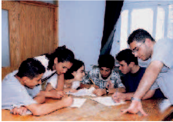
Erstwähler des Jahres 2006: Studenten in Ost-Jerusalem

Bevölkerungsgruppe. In insgesamt nahezu 300 Veranstaltungen sowie Sommercamps