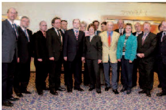
Prager Runde: der erste tschechisch-slowakisch-deutsche Parlamentarierdialog bei der FES.

politische Lösungsansätze im Mittelpunkt, um den sozialen Zusammenhalt in Europa zu stärken und „einen Wettbewerb nach un-