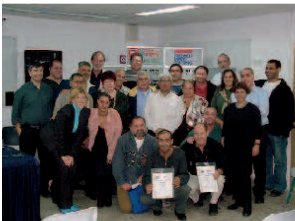
Israelische TeilnehmerInnen einer von der FES unterstützten Betriebsräteschulung.

wurde zwischen der FES und der neuen Histadrutspitze vereinbart, in Zukunft noch mehr Gewicht auf die Professionalisierung junger Gewerkschafter zu legen. Die FES fördert seit Jahren israelisch-deutsche Workshops und Seminare für Auszubildende und deren gewerkschaftliche Interessensvertreter. Diese gelten heute als Modell deutsch-israelischer Begegnungsmaßnahmen, da sie konkrete Ansätze zukunftsorientierter Beziehungen der beiden Völker anbieten, ohne dabei die schmerzvolle gemeinsame Geschichte auszublenden.