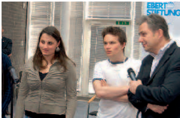
Berlins Regierender Bürgermeister Klaus Wowereit beendet sein Gespräch mit den Jungwähler/innen mit dem Appell: „Bitte gehen Sie wählen!“