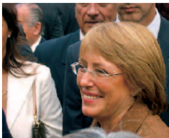
Wo immer die neue Präsidentin bei den Feierlichkeiten zu ihrer Amtseinführung auftauchte, wurde sie von einer jubelnden Menge empfangen.

Am 11. März 2006 wurde im Kongress von Valparaíso ein Stück Geschichte geschrieben: In einer feierlichen Zeremonie wurde Michelle Bachelet in Anwesenheit von 30 Staats- und Regierungschefs als erste Frau in das höchste Staatsamt Chiles vereidigt. Die Sozialistin hatte sich im Januar im zweiten Wahlgang gegen den Kandidaten der Rechten, Sebastián Piñera, durchgesetzt. Das Regierungsbündnis „Concertación“, eine Parteienallianz aus Christdemokraten, Sozialdemokraten und Sozialisten, stellt damit zum vierten Mal in Folge seit dem Ende