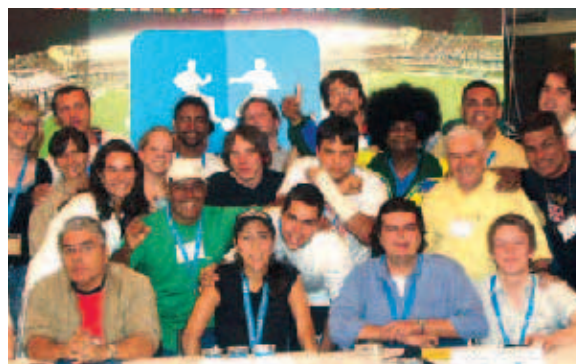
Gute Stimmung in São Paulo: eines der weltweiten Fan-Hearings der Friedrich-Ebert-Stiftung

Politik und Verbänden wurden zu internationalen Hearings in Paris, Warschau, London, São Paulo, Amsterdam, Rom und Prag eingeladen. Dort konnten sie mit Partnern aus Deutschland über ihre Erwartungen an die WM sprechen, Fragen zu den Angeboten in Deutschland diskutieren und internationale Kontakte knüpfen. Die deutschen Teilnehmer präsentierten eine Auswahl der zahlreichen Aktivitäten „von Fans für Fans“. Die Fanvertreter aus dem Ausland waren vielfach von der Programmviefalt beeindruckt, die sie zur WM erwartet. Der Aufbau persön-