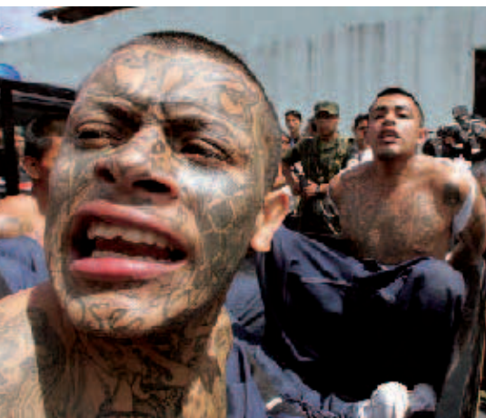
Bis zur letzten Konsequenz: Jugendliche in Mittelamerika finden in Banden oft einen Familienersatz.

Allein im Januar 2006 erfasste die Kriminalitätsstatistik in Guatemala 516 Tote und erreichte damit eine neue Rekordmarke. Manuel Zelaya, der neu gewählte Präsi-