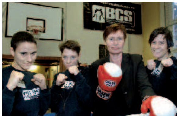
Schlagabtausch: Stadtentwicklungssenatorin Ingeborg Junge-Reyer diskutierte über die integrative Rolle des Sports.