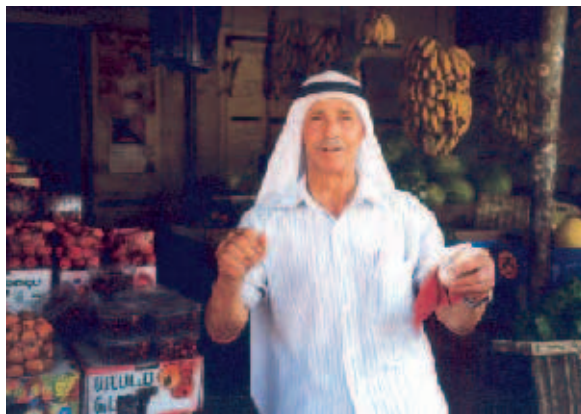
Weit von der Normalität entfernt: palästinensische Händler hoffen auf verstärkten Austausch mit den Nachbarländern.

die Vertretung der FES in den Palästinensischen Autonomiegebieten zusammen mit der FES-Ägypten ein Treffen von Wirtschaftsexperten beider Seiten. Vertreter von Handelsministeri-