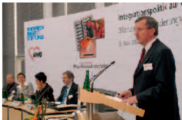
Der AWO-Bundesvorsitzende Wilhelm Schmidt beim Gesprächskreis Migration und Integration.

setzes sind die Integrationskurse. Sie bestehen aus 600 Stunden Sprachkurs und einem 30stündigen Orientierungskurs, in dem Grundkenntnisse der deutschen Geschichte und Demokratie vermittelt werden. Die Teilnehmer begrüßten, dass der Bund Verantwortung für die Integration übernommen hat. Die Praxis zeige jedoch, dass es noch einiges an der Qualität der Kurse zu verbessern gibt.