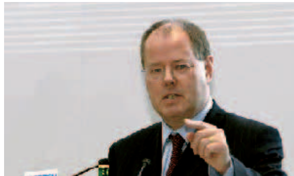
Analysierte die Wirkung des Corporate Governance-Kodex: Bundesfinanzminister Peer Steinbrück.

tiert. Ein Thesenpapier des Managerkreises wurde von Reinhold Kopp, Generalbevollmächtigter der Volks-