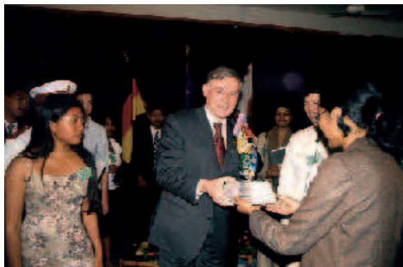
Junge Madagassen aus dem FES-Trainingsprogramm überreichten Bundespräsident Horst Köhler eine Plastik aus wiederverwertetem Altmetall und erklärten ihn zum Ehrenmitglied des YLTP-Jahrgangs 2006.

vestitionen wie die unsichere Rechtsituation und die Probleme