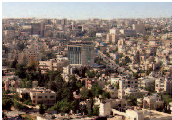
Was denkt Ammans Bevölkerung? Meinungsforschung in Jordanien erlaubt den Blick hinter die Fassaden nicht nur der Hauptstadt.

Umfragen hat das CSS bisher durchgeführt. Das zweite Projekt ist die jährliche Meinungsumfrage zur Demokratie. U. a. wird dort nach dem Demokratieverständnis der Bürger/innen, nach der Rolle des Parlaments, der Parteien und der zivilgesellschaftlichen Organisationen, der Teilhabe der Jugend und der Frauen, der Nutzung nationaler und überregionaler Medien etc. gefragt. Nach der letzten Umfrage gaben die Befragten erstmals der Demokratie auf einer Skala von 10 Punkten die Note 6.29. Andererseits befürchteten immer noch 77 % negative Folgen, wenn sie Kritik an der Regierung oder gar am Königshaus öffentlich äußern würden.