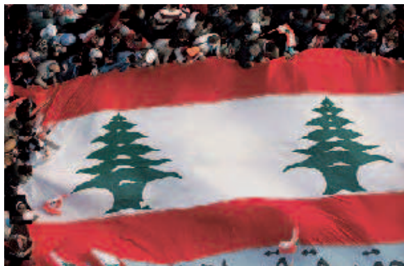
Ein Land im Umbruch: Zivilgesellschaftliche Gruppierungen und OppositionspolitikerInnen aus dem Partnerspektrum der FES bewirkten im Rahmen der sog. Zedernrevolution im Frühjahr 2005 den Rückzug syrischer Truppen aus dem Libanon und die planmäßige Durchführung von Parlamentswahlen.

ten seither die Arbeit des Dachverbandes. Seit Ende 2003 versucht die FES den all-