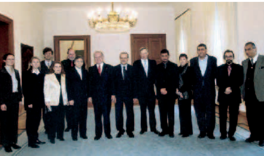
Der damalige Bundes- präsident Johannes Rau hatte bereits 2004 ge- genüber Vertretern der „Genfer Initiative“ die Übernahme der Schirmherrschaft einer später realisierten inter- nationalen Nahostkon- ferenz durch die deut- schen politischen Stiftungen signalisiert.

Die Frage um den zu- künftigen Status der Stadt Jerusalem ist ei- ne der zentralen und zugleich sensibelsten