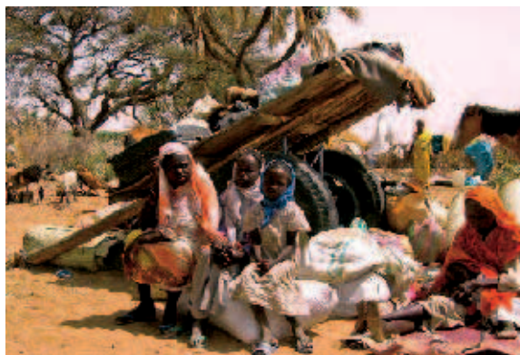
Flüchtlingseind im Sudan: Die FES-Preisträger haben sich ihren Einsatz für die Menschenrechte zur Lebensaufgabe gemacht.

Die von ihm im Jahre 1953 gegründete erste