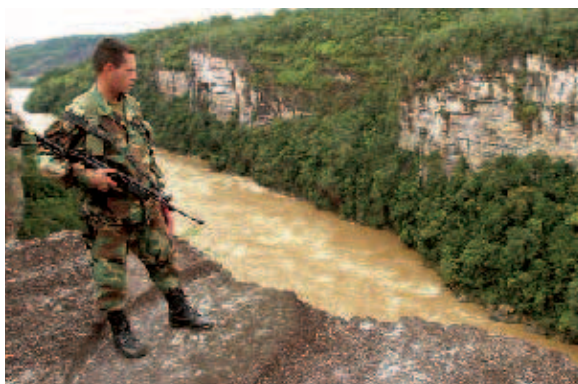
Abwehrhaltung: Die beiderseitigen Interessen an der Grenze zwischen Kolumbien und Ecuador müssen besser in Einklang gebracht werden.

linge aus Kolumbien machten humanitäre Sonderleistungen nötig und belasteten die Sozialpolitik Ecuadors. Das regionale Sicherheitsprojekt der FES-Büros in Ecuador und Kolumbien organisierte vom 2. bis 5. April in einem kleinen kolumbianischen Dorf, Villa de Leyva, Gespräche, bei denen verantwortliche aktive und