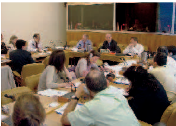
Regelmäßige Informationsrunden: die Journalistenseminare der FES-Genf haben bereits Tradition.

Schutz Geistiger Eigentumsrechte (TRIPS) oder den Streitschlichtungsmechanismus.