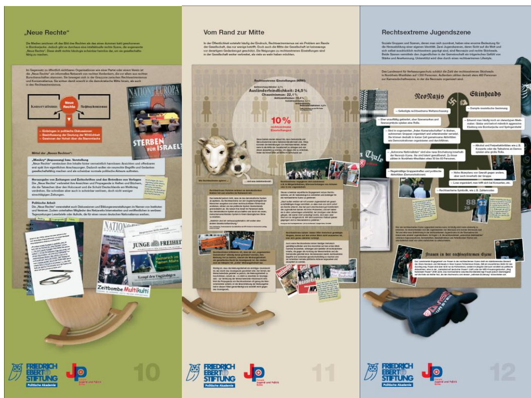
Tafel 10 „Neue Rechte“, Tafel 11 „Vom Rand zur Mitte“ und Tafel 12 „Rechtsextreme Jugendszene“