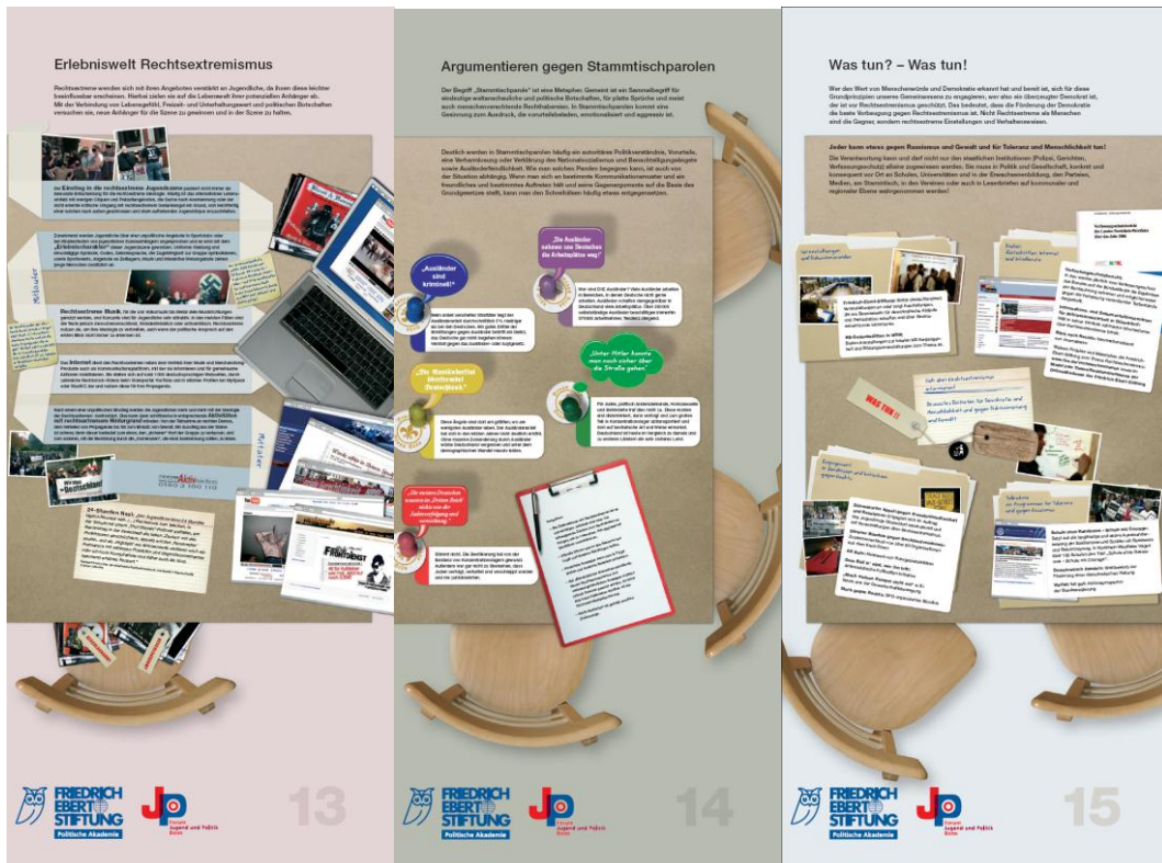
Tafel 13 „Erlebniswelt Rechtsextremismus“, Tafel 14 „Argumentieren gegen Stammtischparolen“ und Tafel 15 „Was tun? – Was tun!“