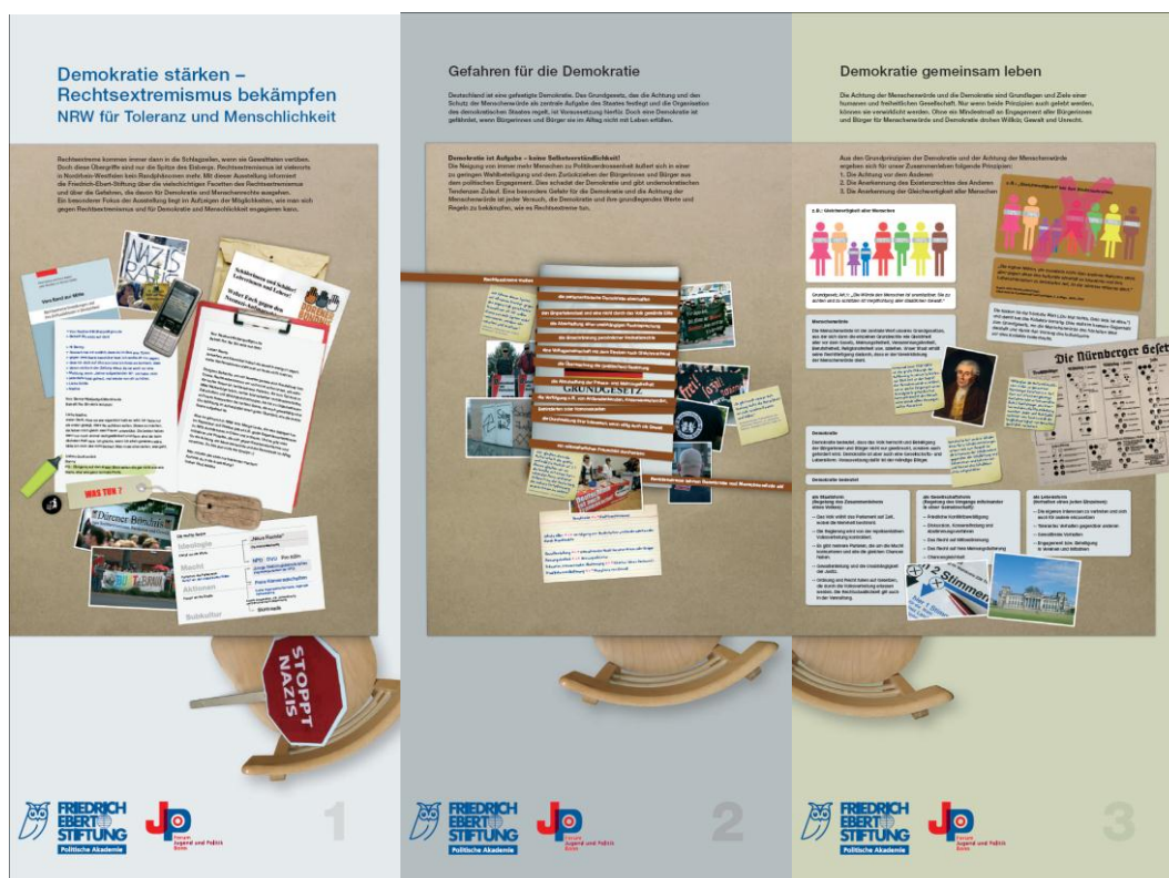
Tafel 1 „Demokratie stärken – Rechtsextremismus bekämpfen“, Tafel 2 „Gefahren für die Demokratie“ und Tafel 3 „Demokratie gemeinsam leben“