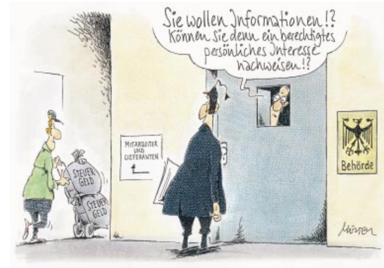
Karikatur: Gerhard Mester